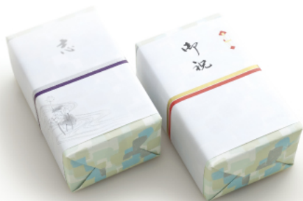
オリジナル (銀・紫2本線)

水引二本をあしらったシンプルで モダンなオリジナル熨斗紙を ご用意しております。ご用途に 合わせた表書き、お名人を承ります。