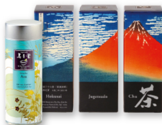
有機煎茶 朝 [北斎赤富士 箱入]