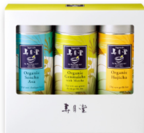
細缶3本ギフトセット [箱入]