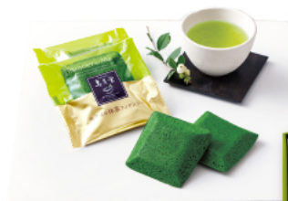
上質な抹茶をたっぷりを使用した 濃厚な抹茶フィナンシェ