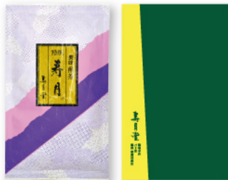
特撰 寿月 [たとう紙入]