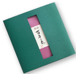
特撰 百年の春 [たとう紙入]

早摘みの新芽から出る 甘露水のようなまったりとした味 ふくよかな香気と澄んだ色 春の息吹を感じる「おいしさ」です。